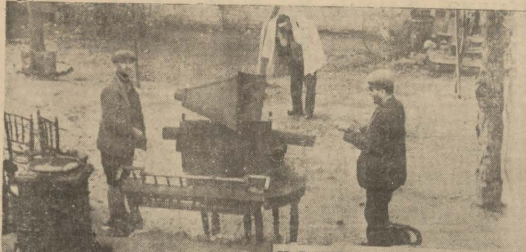
Eskiciler kahvesinin bahçesi şimdi eski ocaklar, sobalar, masalar, lavabolarla dolu..

"— Ulan Enayi Pilâkisi!.. Kaz Mı Yoluyorsun? Ben Böyle Dantelli Donlara Bir Metelik Vermem Be!,"