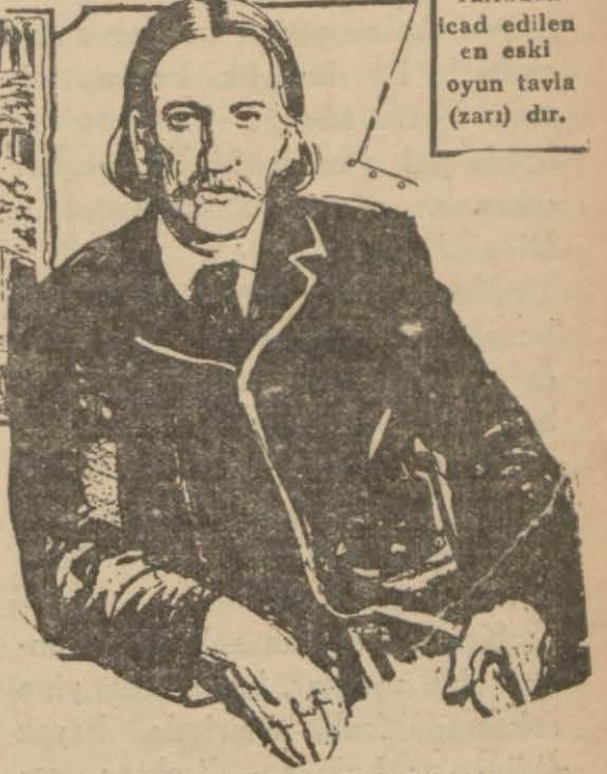
ROBER LOUIS STEVENSON

zü açıklar tarafından evlerine götürülmesi için daima nezaret altında bulundurulmaktadır.