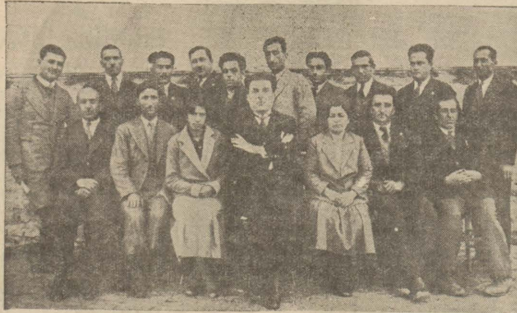
Zara okutucuları Kaymakamla beraber

Akşehir (Hususi) — Akşehir Bankasının Adapazarı Bankası ile olan aksiyon meselelerini hal etmek üzere bir heyet Ankaraya gitmiştir.