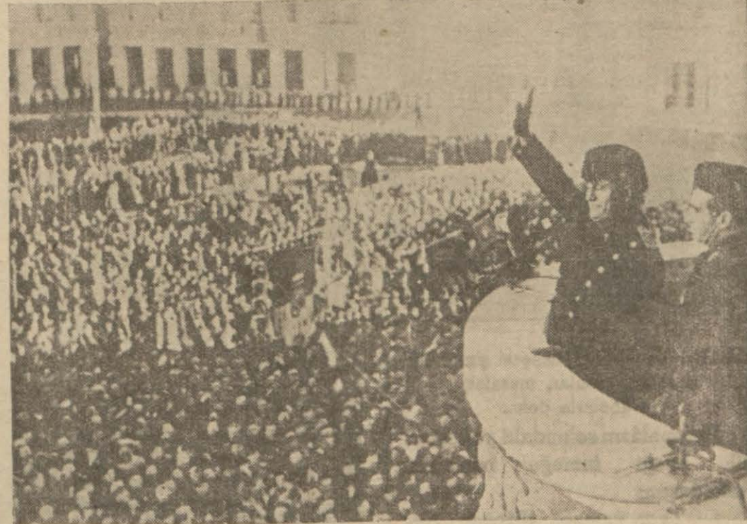
Fransız - İtalyan konuşmaları münasebetile, Almanyanın sıkı bir teşebbüs-karşısında kalan Bay Musolini kurutulan bir bataklıkta yeni bir şehrin kurumunu ilân ediyor

(Beştarafı 1 inci yüzde) gazetesi, hududların değiştirilmesi hakkında Fransız ve İtalyan siyasa-salarını telif için bir mucizeye ihtiyac olduğunu yazıyor ve şu düşünceleri öne sürüyor: