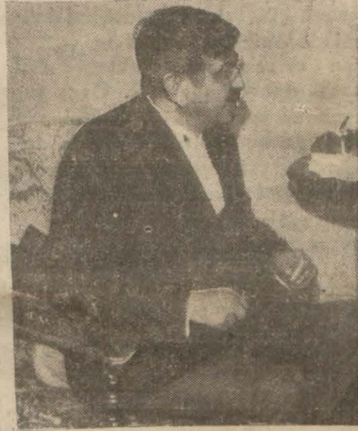
İlk bir hudud taşının değişmesine razı olamayacağına söylüyor Bay Laval

Londra, 1 — M. Lavalın Romaya yapacağı seyahatinin geri bırakılması ihtimalini göz önünde bulunduran Niyuz Kronikl (Devamı 5 inci yüzde)