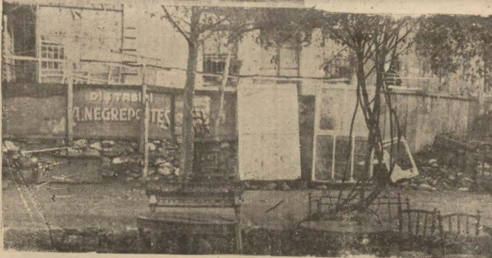
Ucuza kurtardığı iskemleyi yakalayab eskiciler kahvesine getiren bir Yahudi ve kahvenin bahçesi

fanileli baba yiğit elini göğsüne vurarak bağıyordu: